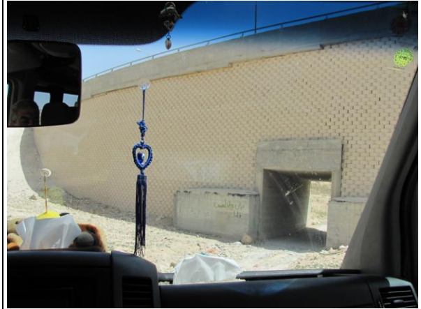
Pictures of the road to the Bedouin village in Wadi Abu Hindi – through a tunnel under the modern highway built to connect two Israeli settlements.

التي سجلت خلال الشهر: الصور للتونق الضيق الذي يصل الى القرية البدوية في وادي ابو هندي حيث يظهر الشارع الاستيطاني الذي ربط المستوطنتان الاسرائيليتان